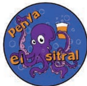
PENYA EL SITRAL