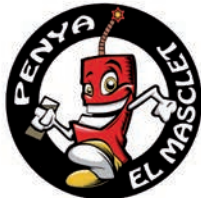
PENYA EL MASCLET