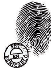
PENYA SECTOR CRÍTIC