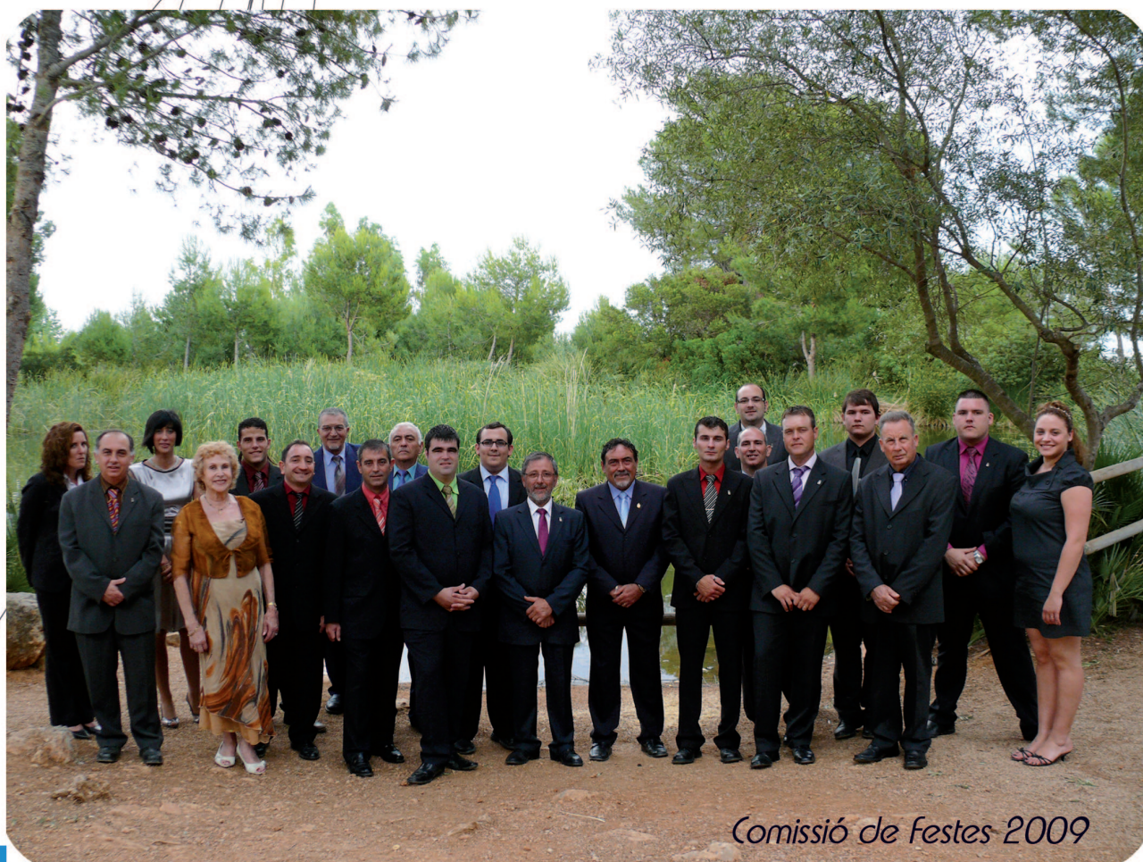
Comissió de Festes 2009