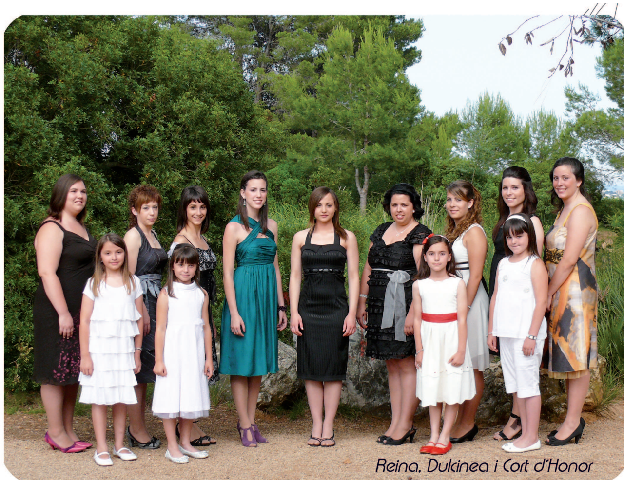
Reina, Dukinea i Cort d'Honor