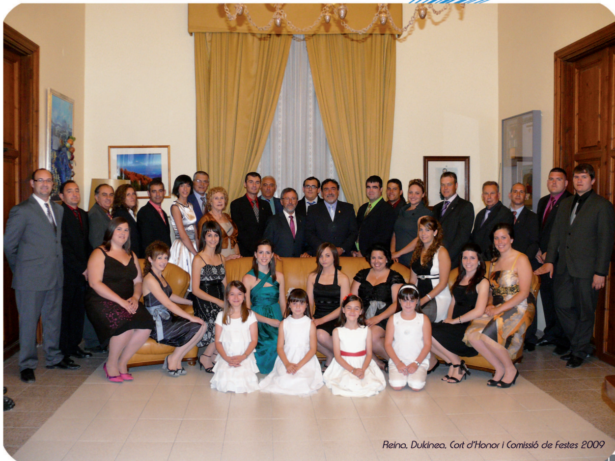
Reina. Dulcinea. Cort d'Honor i Comissió de Festes 2009